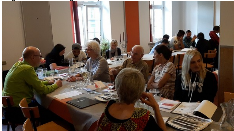
Mitgliederversammlung im Campanile 27.4.18

Der Verein wird finanziell und strukturell weiterhin solide organisiert. Im Jahr 2018 gab es allerdings erneut nur eine geringfügige Weiterentwicklung im Bereich der Mitgliederzahlen. Es zeigt sich, dass die Beteiligung und Unterstützung unseres Vereins weiterhin sehr bescheiden ist. Wünschenswert wären Aktivitäten zur Werbung neuer Mitglieder und Fördermitglieder. Im Einzelnen: