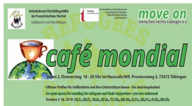
Cafe Mondial Flyer

Das Cafe Mondial wurde auch im Jahr 2018 unterstützt von der Stadt Tübingen. Über einen Projektantrag erhielt der Verein einen Zuschuss von 1.130,00 Euro (2017: 3.500 Euro) für den