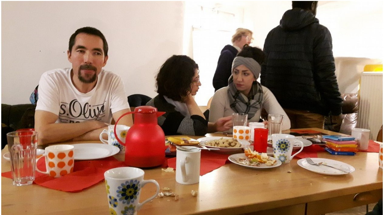
07.12.2018 Cafe Mondial Weihnachtsfeier