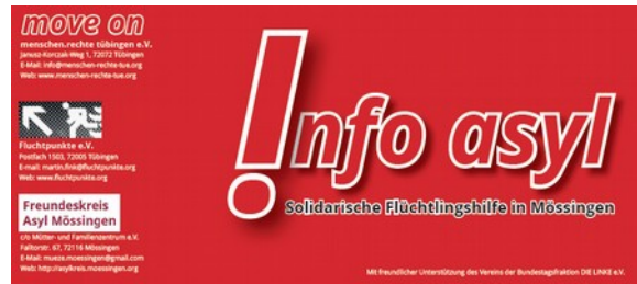
Flyer Beratungsstelle info asyl

Der Integrationsbeauftragte der Stadt Mössingen, move on – menschen.rechte Tübingen e.V., Fluchtpunkte Tübingen e.V. und Freundeskreis Asyl Mössingen laden ein: