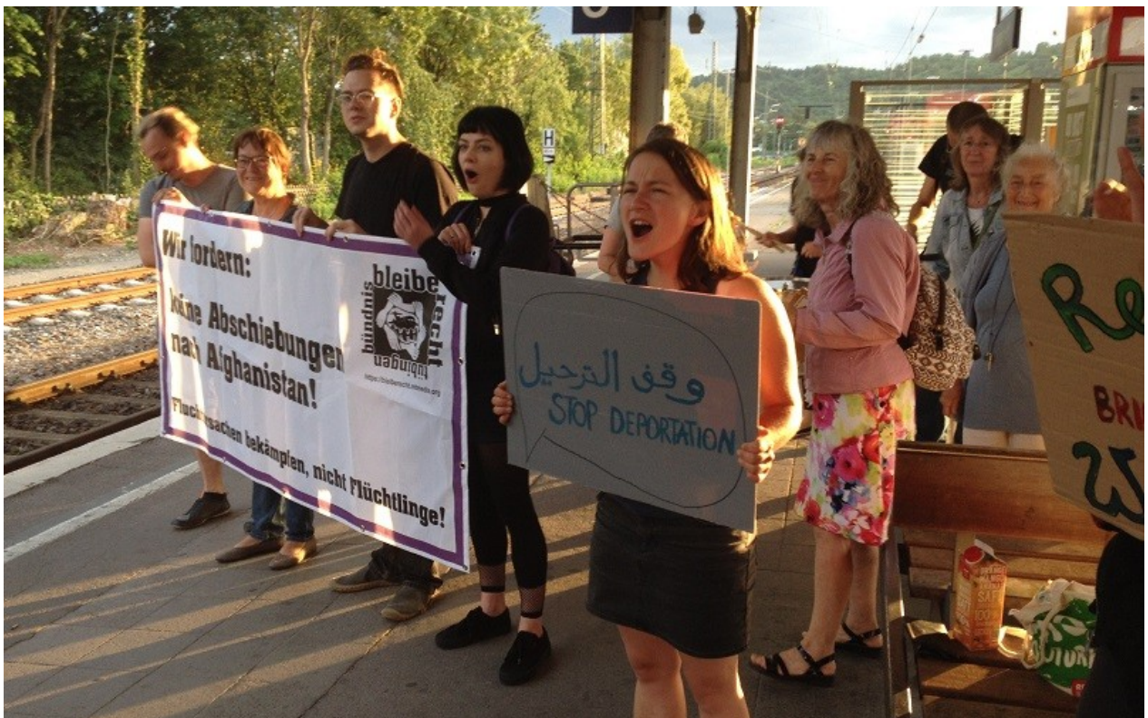
Abendlicher Empfang am Hauptbahnhof Tübingen